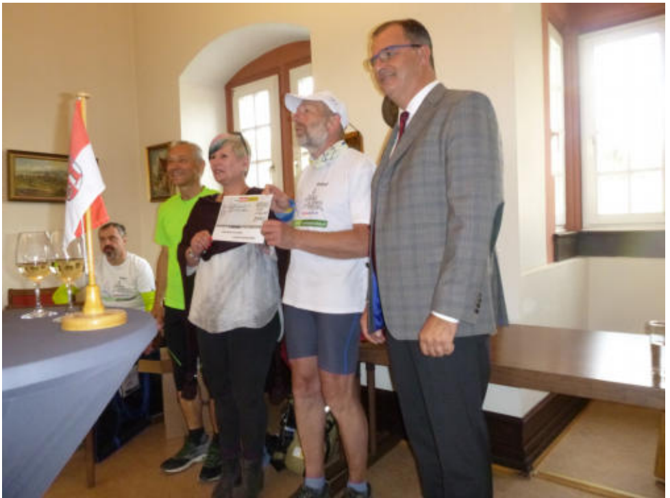
Spendenübergabe in Kiedrich