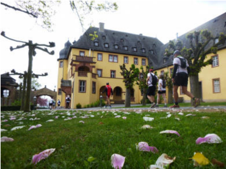
Zwischenstopp im Weingut Schloss Vollrads

Von 2006 bis 2017 zeigten sie hunderten LäuferInnen und WandererInnen das Rheintal im Laufschrift. Ziel war von Anfang an nicht, möglichst schnell das Tagesziel zu erreichen, sondern Landschaft und Gemeinschaft zu genießen. Unterwegs sammelten sie einen sechsstelligen Betrag für Benni & Co und gegen die Duchenne-Muskeldystrophie. Mit der 13. Ausgabe übergaben sie das Staffelholz an vier längjährige TeilnehmerInnen.