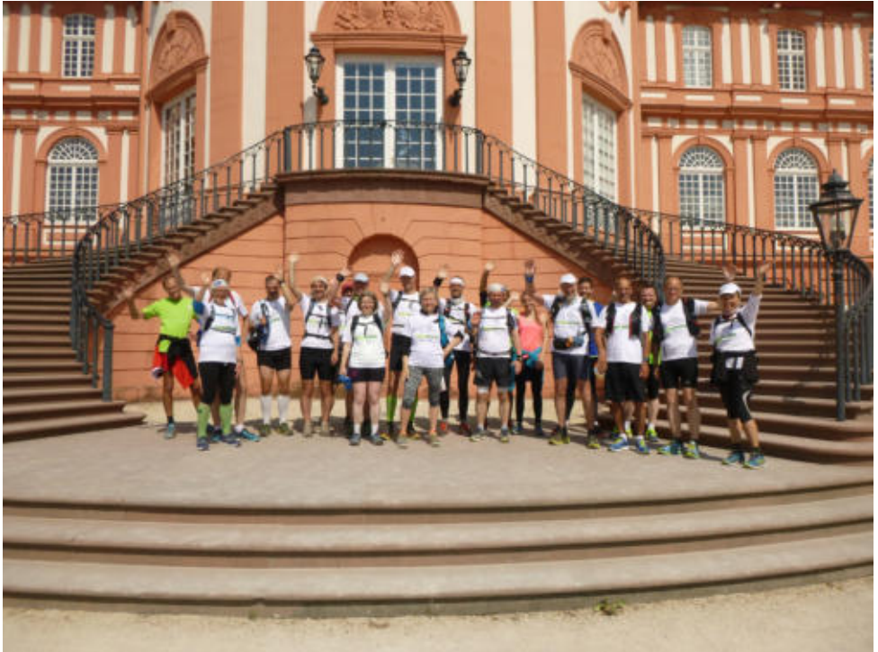
Das Ziel: Schloss Biebrich

Hinzu kommt ein Spendenbeitrag von 20 Euro/Tag.