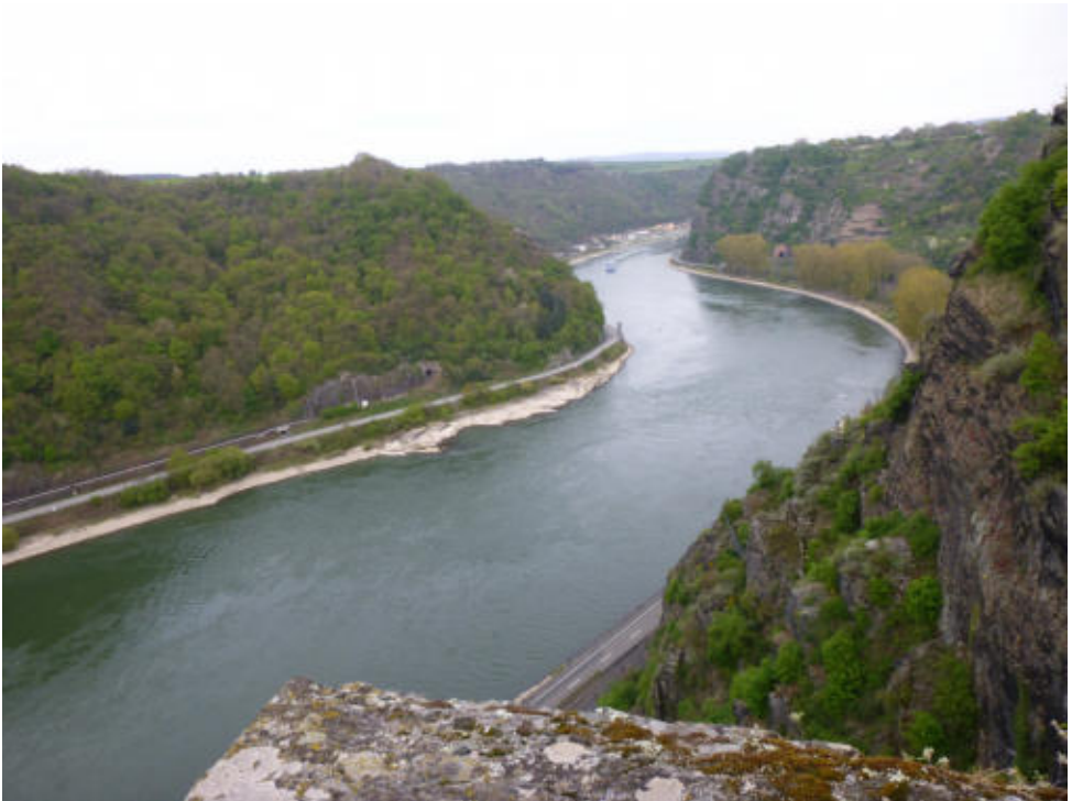
Blick auf die Loreley