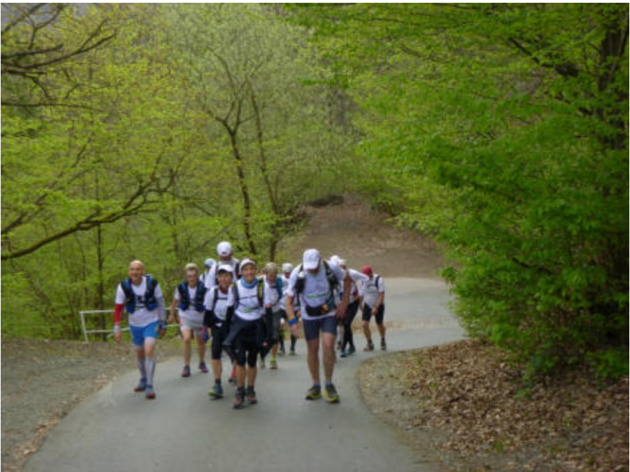
Laufen in der Gruppe - für manche ungewohnt

Die Wandergruppe bestimmt ihre Strecken von 20 bis 25 km selbst.