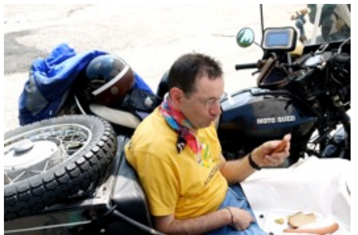
Rast am Seibelseckle Bockwurst und Wienerle sind dort sehr zu empfehlen !