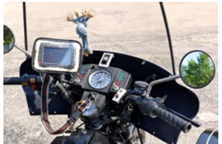
Cockpit mit Schwarzwaldelch an der Scheibe

Für Interessierte: Moto Guzzi V 1000 G 5, Baujahr 1982. Beiwagen ein legendärer „Ural“