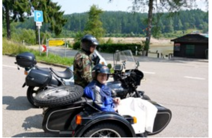
Stopp an der Schwarzenbachtalsperre