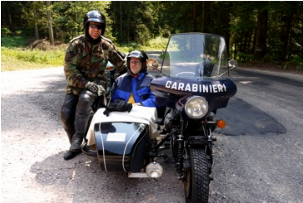
Stopp am Freiersberg auf der Höhe